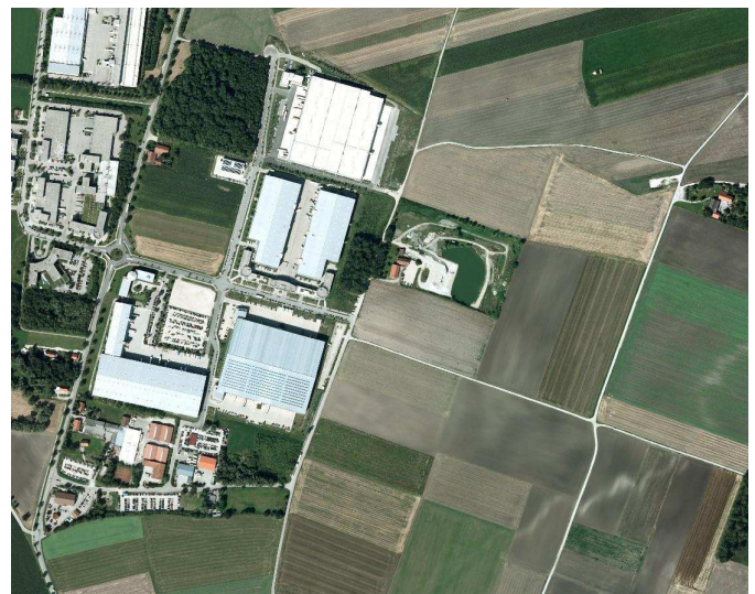
Luftbild der Gewerbeflächen Schwaig

Alle flughafenbezogenen Gewerbe sind in der Gemeinde herzlich willkommen.