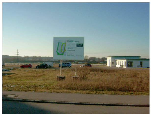
Foto des Gewerbegebiets

Die Gemeinde hat keine speziellen Prioritäten für Neuansiedlungen in diesem Gewerbegebiet, Unternehmer aller Branchen sind willkommen.