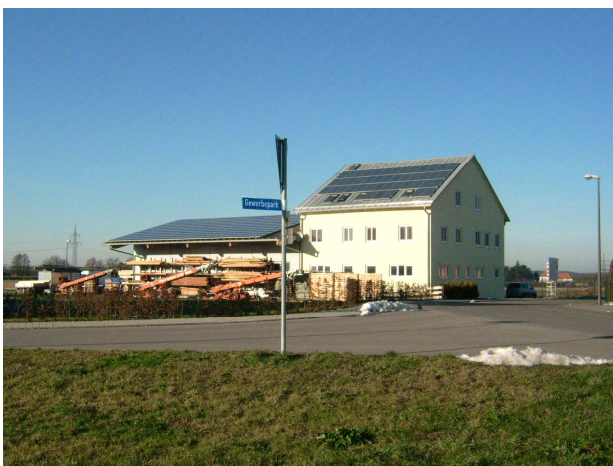
Foto des Gewerbegebiets

Dazu zählen auch eine mindestens 10 m breite Eingrünung zum Landschaftsschutzgebiet sowie die ökologischen Ausgleichsmaßnahmen.