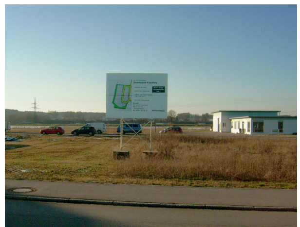
Foto des Gewerbegebiets

Die Gemeinde hat keine speziellen Prioritäten für Neuansiedlungen in diesem Gewerbegebiet, Unternehmer aller Branchen sind willkommen.