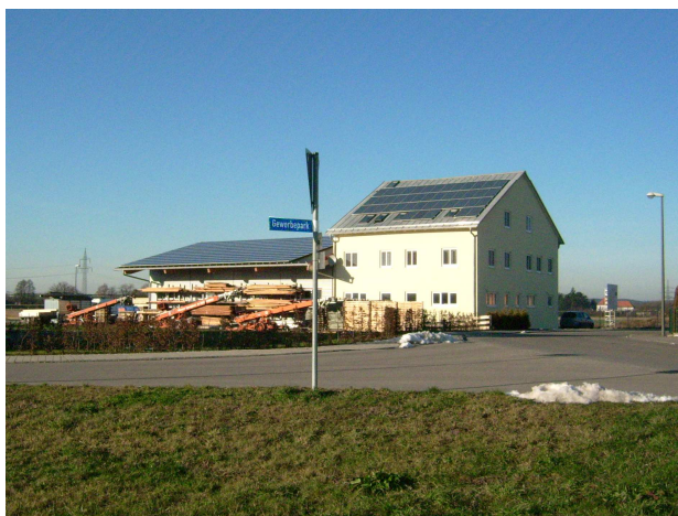
Foto des Gewerbegebiets

Dazu zählen auch eine mindestens 10 m breite Eingrünung zum Landschaftsschutzgebiet sowie die ökologischen Ausgleichsmaßnahmen.