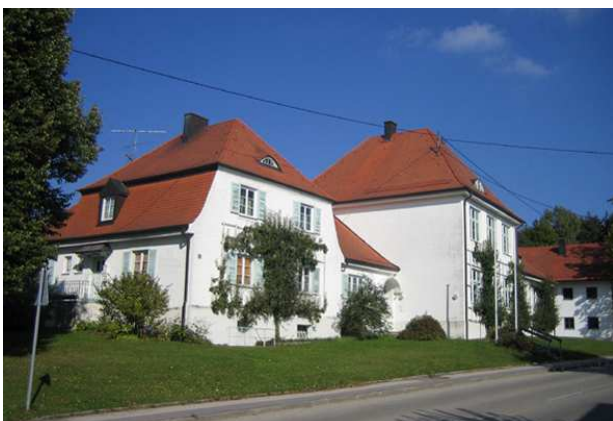
Gemeindehaus Buch am Buchrain

Gemeinde Buch am Buchrain / Vg. Pastetten Fröbelweg 1 85669 Pastetten